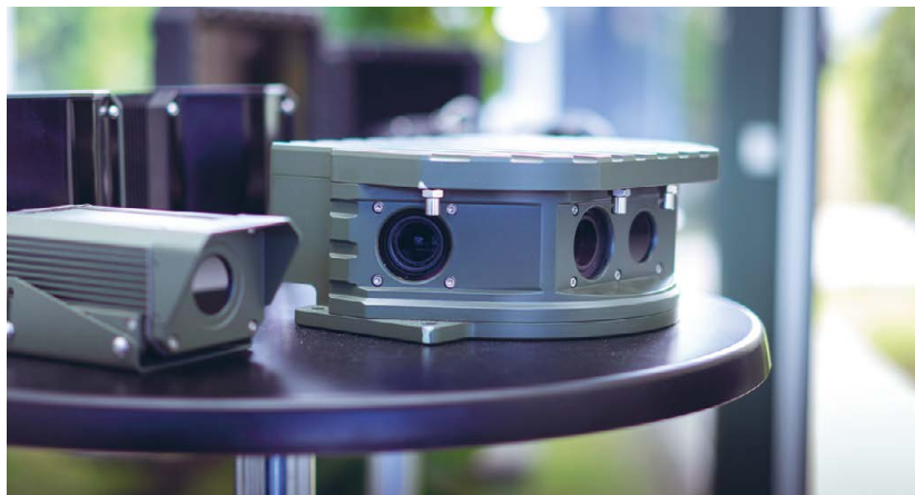
Copenhagen Sensor Technology producerer komplekse overvågningskameraer.

Copenhagen Sensor Technology's lange liste af slutkunder tæller blandt andet en række forsvarsmyndigheder. Ofte kræ-